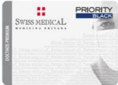
Cred. PAE Blue